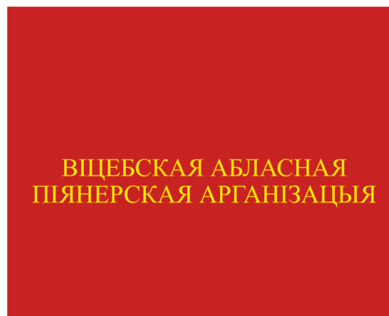
Знамя областной (Минской городской) пионерской организации (оборотная сторона)