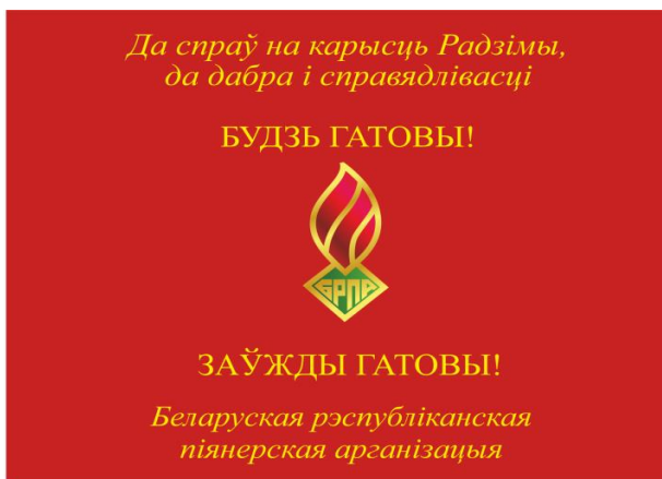
Знамя районной (городской) пионерской организации (лицевая сторона)