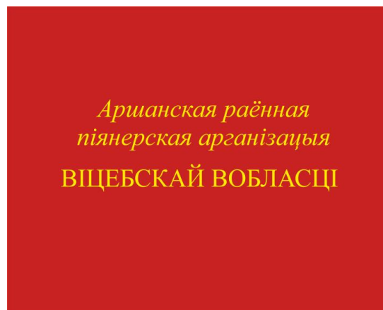
Знамя районной (городской) пионерской организации (оборотная сторона)