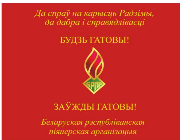
Знамя областной (Минской городской) пионерской организации (лицевая сторона)