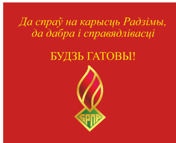
Знамя ОО «БРПО» (оборотная сторона)