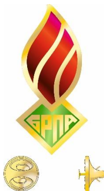
Значок «Центральный Совет»