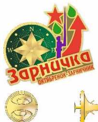
Новая визуализация БРПО, талисман БРПО